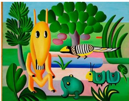
A Cuca, 1924