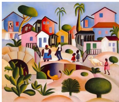
Morro da Favela, 1924